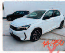
OPEL Corsa 1.2 100 CV GS

Prezzo: 15.900 € Colore: Bianco pastello Interni: Tessuto Carburante: Benzina Immatricolazione: 04/2025 Km: 7960