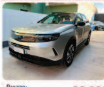
OPEL Grandland 1.2 Hybrid aut. GS

Prezzo: 26.900 € Colore: Grigio tetto Nero metallizzato Interni: Grigio Pelle/Tessuto Carburante: Elettrica/Benzina Immatricolazione: 03/2025 Km: 18080