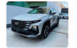
HYUNDAI Tucson 1.6 CRDI 48V DCT Business

Prezzo: 31.990 € Colore: Bianco pastello Interni: Tessuto Carburante: Elettrica/Diesel Immatricolazione: 01/2026 Km: 0