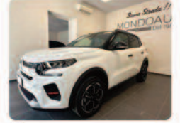
CITROEN C3 PureTech 100 S&S Max

Prezzo: 19.500 € Colore: Bianco metallizzato Interni: Grigio Tessuto Carburante: Benzina Immatricolazione: 04/2026 Km: 0