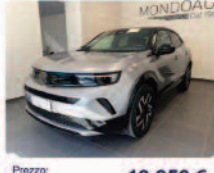
OPEL Mokka 1.2 Turbo 136 CV GS

Prezzo: 19.950 € Colore: Grigio metallizzato Interni: Grigio scuro Tessuto Carburante: Benzina Immatricolazione: 03/2025 Km: 20160