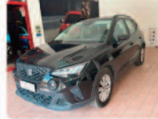
SEAT Arona 1.0 TGI Style

Prezzo: 10.950 € Colore: Nero pastello Interni: Grigio scuro Carburante: Benzina/Metano Immatricolazione: 05/2022 Km: 76334