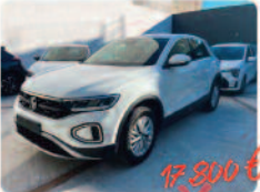
VOLKSWAGEN T-Roc 1.0 TSI Style

Prezzo: 18.800 € Colore: Bianco pastello Interni: Tessuto Carburante: Benzina Immatricolazione: 01/2023 Km: 65661