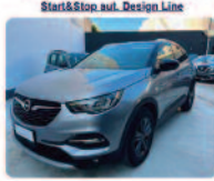
OPEL Grandland X 1.5 diesel Ecotec Start&Stop aut. Design Line

Prezzo: 17.950 € Colore: Grigio tetto Nero metallizzato Interni: Grigio scuro Carburante: Pelle/Tessuto Immatricolazione: Diesel Km: 08/2021 62460