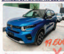
CITROEN C3 PureTech 100 S&S Max

Prezzo: 19.800 € Colore: blu obsession metallizzato Interni: Grigio Tessuto Carburante: Benzina Immatricolazione: 03/2026 Km: 0