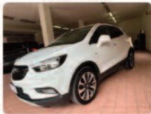
OPEL Mokka X 1.6 CDTI Ecotec 136CV 4x2 Start&Stop Ultimate

Prezzo: 12.900 € Colore: Bianco pastello Interni: Grigio scuro Carburante: Pelle/Tessuto Immatricolazione: Diesel Km: 03/2019 61633