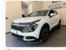
KIA Sportage 1.6 CRDI MHEV DCT Business

Prezzo: 28.950 € Colore: Bianco pastello Interni: Nero Tessuto Carburante: Elettrica/Diesel Immatricolazione: 03/2025 Km: 14960