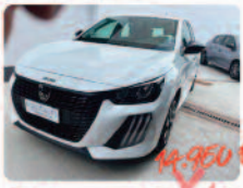
PEUGEOT 208 PureTech 75 Stop&Start 5 porte Style

Prezzo: 15.950 € Colore: Bianco pastello Interni: Grigio Tessuto Carburante: Benzina Immatricolazione: 04/2025 Km: 14825