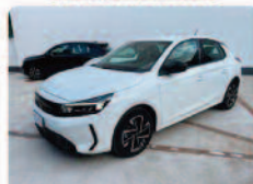
OPEL Corsa 1.2 100 CV GS

Prezzo: 15.900 € Colore: Bianco pastello Interni: Tessuto Carburante: Benzina Immatricolazione: 04/2025 Km: 7960