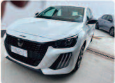
PEUGEOT 208 PureTech 75 Stop&Start 5 porte Style

Prezzo: 15.950 € Colore: Bianco pastello Interni: Grigio Tessuto Carburante: Benzina Immatricolazione: 04/2025 Km: 14825