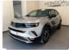
OPEL Mokka 1.2 Turbo 136 CV GS

Prezzo: 19.950 € Colore: Grigio metallizzato Interni: Grigio scuro Tessuto Carburante: Benzina Immatricolazione: 03/2025 Km: 20150