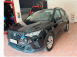
SEAT Arona 1.0 TGI Style

Prezzo: 10.950 € Colore: Nero pastello Interni: Grigio scuro Carburante: Benzina/Metano Immatricolazione: 05/2022 Km: 76334