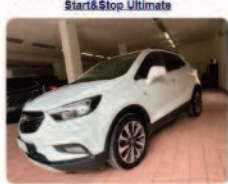
OPEL Mokka X 1.6 CDTI Ecotec 136CV 4x2 Start&Stop Ultimate

Prezzo: 12.900 € Colore: Bianco pastello Interni: Grigio scuro Carburante: Pelle/Tessuto Immatricolazione: Diesel Km: 03/2019 61833