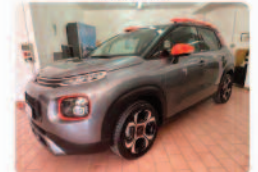
CITROEN C3 Aircross BlueHDI 120 S&S EAT8 Shine

Prezzo: 13.900 € Colore: Grigio metallizzato Interni: Nero Tessuto Carburante: Diesel Immatricolazione: 01/2019 Km: 72000