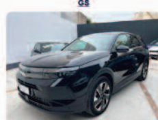
OPEL Grandland 1.2 Hybrid 136 CV EDCT GS

Prezzo: 26.950 € Colore: Nero metallizzato Interni: Grigio scuro Carburante: Pelle/Tessuto Immatricolazione: Elettrica/Benzina Km: 01/2025 17672