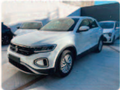
VOLKSWAGEN T-Roc 1.0 TSI Style

Prezzo: 18.800 € Colore: Bianco pastello Interni: Tessuto Carburante: Benzina Immatricolazione: 01/2023 Km: 65661