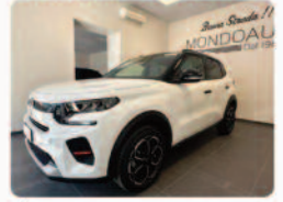
CITROEN C3 PureTech 100 S&S Max

Prezzo: 19.500 € Colore: Bianco metallizzato Interni: Grigio Tessuto Carburante: Benzina Immatricolazione: 04/2026 Km: