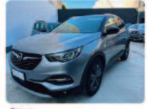
OPEL Grandland X 1.5 diesel Ecotec Start&Stop aut. Design Line

Prezzo: 17.950 € Colore: Grigio tefo Nero metallizzato Interni: Grigio scuro Carburante: Pelle/Tessuto Immatricolazione: Diesel Km: 08/2021 62450