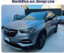
OPEL Grandland X 1.5 diesel Ecotec Start&Stop aut. Design Line

Prezzo: 17.950 € Colore: Grigio tefo Nero metallizzato Interni: Grigio scuro Carburante: Pelle/Tessuto Immatricolazione: Diesel Km: 08/2021 62460