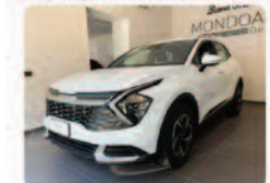
KIA Sportage 1.6 CRDI MHEV DCT Business

Prezzo: 28.950 € Colore: Bianco pastello Interni: Nero Tessuto Carburante: Elettrica/Diesel Immatricolazione: 03/2025 Km: 14950