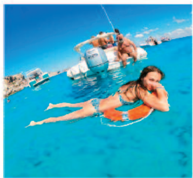
ESCURSIONI IN BARCA/VELA ( San Vito - Egadi)