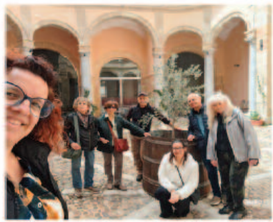
VISITE GUIDATE E TOUR IN CANTINA