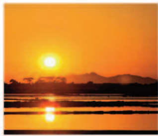
TRANSFER AEROPORTO - SALINE - SPIAGGE