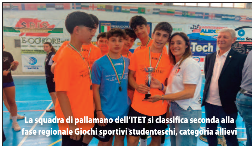
La squadra di pallamano dell'ITET si classifica seconda alla fase regionale Giochi sportivi studenteschi, categoria allievi

Con questo numero si conclude il terzo anno della ripresa del Millennium , il giornale della nostra scuola, nato originariamente negli anni '90. Dopo una lunga pausa, lo abbiamo riportato in vita, spinti dal desiderio di raccontarci, di dare voce a ciò che accade ogni giorno tra le mura della scuola e nei tanti spazi in cui impariamo, cresciamo, costruiamo insieme. Oggi il Millennium è tornato a essere uno strumento prezioso, una voce corale. È un modo per mettere ordine al nostro cammino, per raccontare alla città le tante attività che rendono viva e dinamica la nostra comunità scolastica. Progetti, laboratori, esperienze sul territorio, incontri, riflessioni e sogni: tutto trova spazio in queste pagine. Ci piace arricchire ogni numero con tante immagini, che parlano da sole. Gli scatti catturano momenti autentici, sorrisi, gesti, emozioni: sono un modo di-