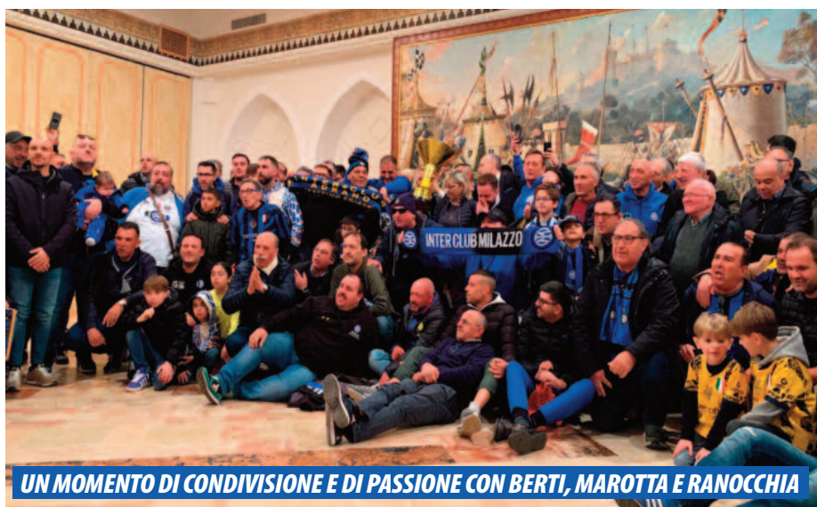
UN MOMENTO DI CONDIVISIONE E DI PASSIONE CON BERTI, MAROTTA E RANOCCHIA

Si è svolta nei giorni scorsi con grande entusiasmo e partecipazione, la tradizionale riunione di fine anno dell'Inter Club di Petrosino, che ha visto l'affetto e la passione dei nerazzurri unirsi sotto il segno dell'Inter, simbolo di famiglia e solidarietà. L'evento, che ha ospitato la Sicilia Nerazzurra, ha rappresentato una giornata speciale per tutti i presenti, tra tifosi, dirigenti e leggende del club. L'Inter è più di una squadra: è una famiglia. Questo è stato il tema centrale della giornata, come sottolineato da molti dei protagonisti dell'evento. "Una famiglia significa sostenersi l'uno con l'altro", hanno dichiarato i soci. E, proprio come una famiglia, l'atmosfera che ha permeato il raduno è stata di unione, amicizia e passione condivisa per