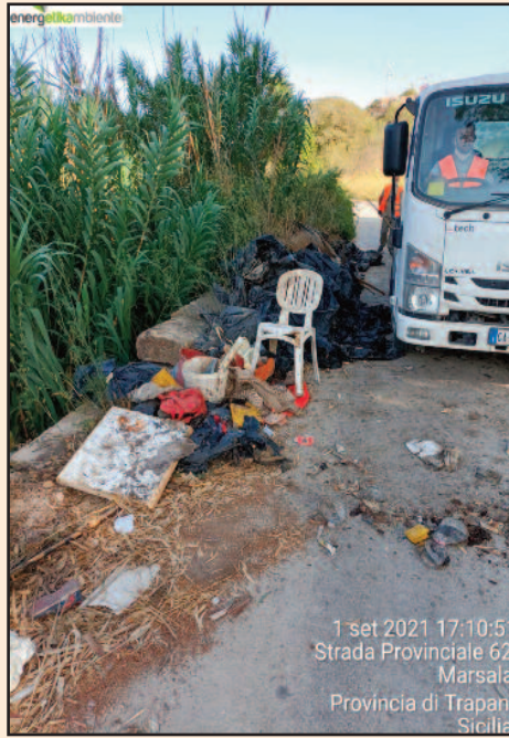
1 set 2021 17:10:51 Strada Provinciale 62 Marsala Provincia di Trapani Sicilia