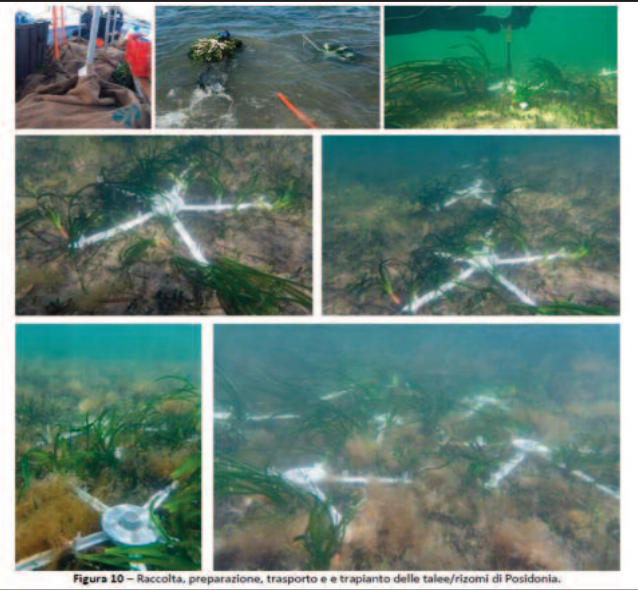
Figura 10 - Raccolta, preparazione, trasporto e trapianto delle talee/rizomi di Posidonia.

Si è concluso l'intervento volto alla riforestazione della posidonia nello Stagnone di Marsala. È un primo progetto che, nella Riserva, sarà seguito dagli interventi previsti dal più complesso progetto "Rinascite" che, con il Comune, vede coinvolti il Libero Consorzio di Trapani gestore e il Consorzio Nazionale Interuniversitario per le Scienze del Mare. Circa 400 mila euro il finanziamento regionale per questo intervento pilota di "trapianto sperimentale di posidonia oceanica", al fine di testarne la fattibilità tecnica per una sua riproduzione su larga scala anche con il progetto. Dopo le indagini di mappatura per individuare le zone idonee al trapianto, i tecnici di Planetek Italia, E-Geos e Biosurvey, anche tramite immagini satellitari, hanno realizzato due impianti sperimentali: una tra Punta Palermo e Punta Stagnone, l'altra tra quest'ultima e Punta dell'Alga. Sono stati trapiantati moduli portanti talee di posidonia, sulla scorta di quanto già realizzato nell'ambito di PON di ricerca/innovazione sia a Capo Feto che nel Golfo di Palermo. In particolare, l'impianto è stato realizzato impiegando un prodotto innovativo costituito da un modulo di ancoraggio biodegradabile. Un sistema a basso impatto ambientale utile per il fissaggio di organismi vegetali