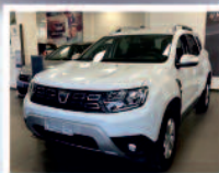
DACIA DUSTER 1.5 CDTI115 CV CONFORT ANNO: 06/2021 KM: 0 ACC: NAV+RETROCAMERA €. 20.500