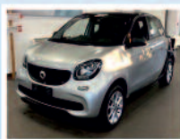
SMART FORFOUR 1.0 PASSION 71 CV ANNO: 02/19 KM: 50.164 €. 12.200