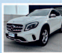
MERCEDES GLA 200 SPORT ANNO: 10/17 KM: 118.530 €. 24.900