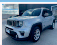
JEEP RENEGADE 1.6 MJT 120 CV DIESEL ANNO: 02/2019 KM: 63.950 €. 23.800