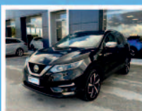
NISSAN DASHQAI 1.6 DCI 2WD DIESEL ANNO: 05/2018 KM: 57.453 €. 24.900