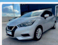
NISSAN MICRA 1.5 DCI 8V 5 PORTE DIESEL ANNO: 06/2018 KM: 60.372 €. 14.500