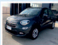
FIAT 500 X 1.3 MTJ 95 CV POP STAR ANNO: 12/17 KM:61.300 €. 16.300