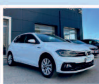
VW POLO 1.6 TDI 95 CV 5 P HIGHLINE KM: 49859 ANNO: 02/2018 €. 16.800