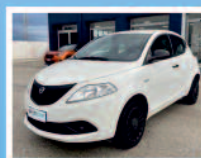
LANCIA YPSILON 1.2 69CV 5 PORTE GPL ECOCHIC ELEC. BLU KM: 67.155 ANNO 03/2019 €. 12.450