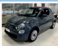
FIAT 500C 1.2 LOUNGE BENZINA KM: 49.450 ANNO 05/2019 €. 14.800