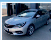
OPEL ASTRA 1.5 CDTI 122CV S&S DIESEL ANNO: 12/2019 KM: 10.640 €. 21.950