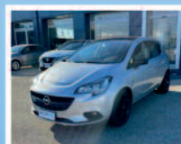
OPEL CORSA 1.2 5 PORTE BENZINA KM: 50.980 ANNO 04/2019 €. 11.950