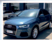
AUDI Q3 2.0 150 CV TDI BUSINESS ANNO: 04/17 KM:111.952 €. 21.600