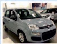
FIAT PANDA 1.0 EASY HYBRID KM 0 ANNO: 07/2021 €. 12.900