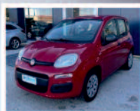
FIAT PANDA 1.2 EASY BENZINA ANNO: 09/2015 KM: 29.272 €. 8.950