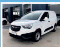
OPEL COMBO CARGO 1.5 DIESEL 100CV S&S PC 650KG ANNO: 02/2020 KM: 79.021 €. 16.500