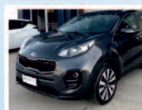
KIA SPORTAGE 1.7 CRDI CLASS 115 CV ANNO:04/17 KM: 94.091 ACC: NAV RETROCAM. POST €. 19.300