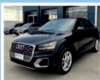
AUDI Q2 1.6 TDI SPORT DIESEL KM: 96.400 ANNO 08/2018 €. 24.900