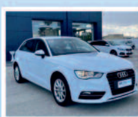
AUDI A3 1.6 TDI S TRONIC BUSINESS KM 125630 ANNO: 04/2016 €. 17.600