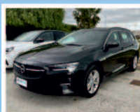
OPEL INSIGNIA 1.5 CDTI S&S SPORT DIESEL ANNO: 12/2020 KM: 4.797 €. 26.950