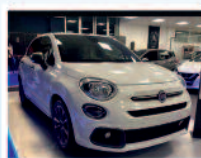
FIAT 500 X 1.6 MULTIJET 130 CV SPORT KM/0 ANNO 07/2021 €. 25.900