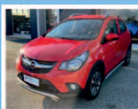
OPEL KARL ROCKS 1.0 73 CV BENZINA ANNO: 06/2019 KM: 48.816 €. 11.850