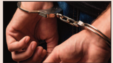
...l'articolo a pag. 2