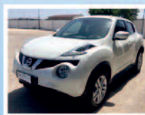
NISSAN JUKE 1.5 CDI 110 CCV N-CONNECTA ANNO:01/18 KM: 33.662 ACC:NAV € 14.950