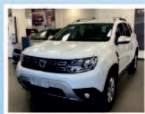
DACIA DUSTER 1.5 CDI115 CV CONFORT ANNO: 06/2021 KM: 0 ACC: NAV+RETROCAMERA € 20.500