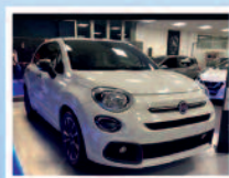
FIAT 500 X 1.6 MULTIJET 130 CV SPORT KM/0 ANNO 07/2021 € 25.900