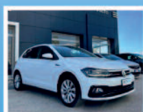
VW POLO 1.6 TDI 95 CV 5 P HIGHLINE KM: 49859 ANNO: 02/2018 € 16.800