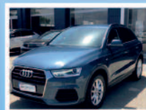
AUDI Q3 2.0 150 CV TDI BUSINESS ANNO: 04/17 KM:111.952 € 21.600