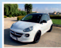
OPEL ADAM 1.2 70 CV JAM ANNO:02/15 KM: 38.800 UNICO PROPRIETARIO € 8.900