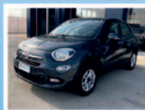
FIAT 500 X 1.3 MTJ 95 CV POP STAR ANNO: 12/17 KM:61.300 € 16.300