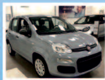
FIAT PANDA 1.0 EASY HYBRID KM 0 ANNO: 07/2021 € 12.900