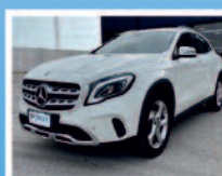
MERCEDES GLA 200 SPORT ANNO: 10/17 KM: 118.530 € 24.900