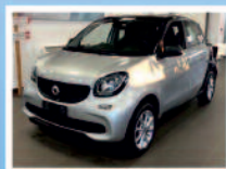
SMART FORFOUR 1.0 PASSION 71 CV ANNO: 02/19 KM: 50.164 € 12.200