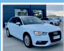
AUDI A3 1.6 TDI S TRONIC BUSINESS KM 125630 ANNO: 04/2016 € 17.600