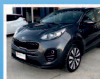
KIA SPORTAGE 1.7 CRDI CLASS 115 CV ANNO:04/17 KM: 94.091 ACC: NAV RETROCAM. POST € 19.300