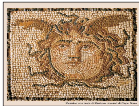
Mosaico con testa di Medusa, Isola I di Capo Bonas

di Ovidio. In particolare il mito di Perseo e la Gorgone/Medusa viene rievocato dalle testimonianze archeologiche di Lilibeo, come il mosaico dell'Isola I con la rappresentazione della testa della Gorgone/Medusa e alcune terrecotte su cui essa è rappresentata. Il concerto è dedicato a Peppino Impastato e fu presentato per la prima volta al pubblico nazionale, dai microfoni di Rai Radio Tre nella trasmissione "Battiti", condotta da Pino Saulo.