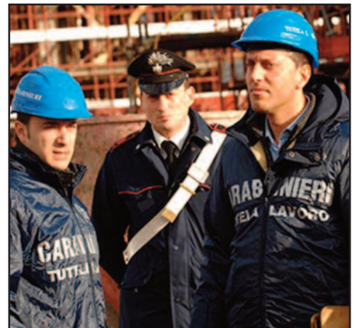
tallici in uso per le lavorazioni in quota dei sistemi atti a limitare i rischi di caduta e non aver consegnato i previsti dispositivi di protezione individuale.