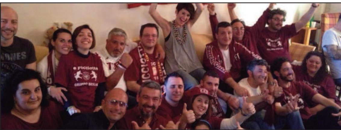
I MARSALESI TIFOSI DEL TORINO