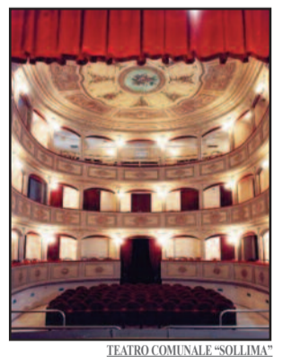
TEATRO COMUNALE "SOLLIMA"