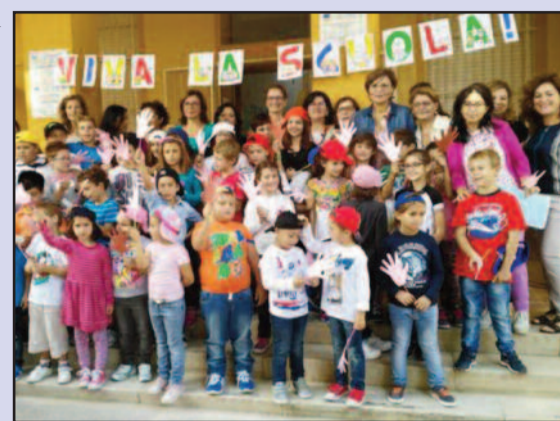
GLI ALUNNI DEL PLESSO MOZIA