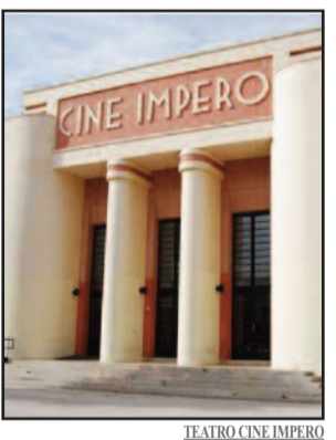
TEATRO CINE IMPERO