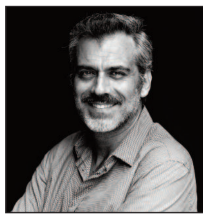
a cura di Franco Gambino

Tondi, De Bartoli, Pellegrino e Colomba Bianca. Il percorso fotografico si articola in 2 sezioni: la prima dedicata all'essere umano, dove il soggetto fondamentale è la fisicità e la sensualità della donna che si fa un tuttuno con la natura, e la seconda dedicata ai luoghi, esposta a cadenza settimanale, dove il viaggio è il tema centrale, scandendo i lavori realizzati tra moda, reportage, landscapes e baskstages in diversi continenti: Asia, Africa, Europa ed Americhe.