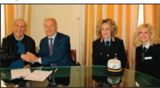
LA SIGLA DEL PROTOCOLLO