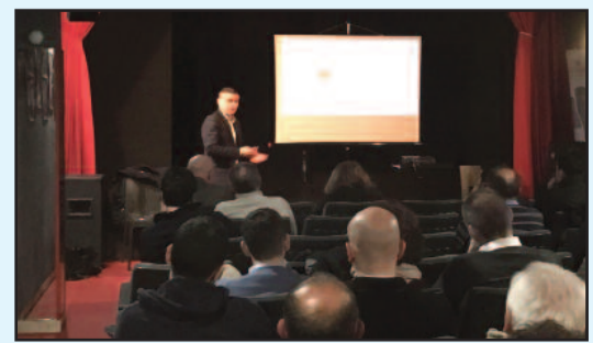
UN RECENTE MEETING LYONESSE SVOLTOSI AL BALUARDO VELASCO

350 mila imprese, aziende ed attività convenzionate. La mission del team di esperti della MoPiline di Lyonesse, proveniente dalla città di Massa