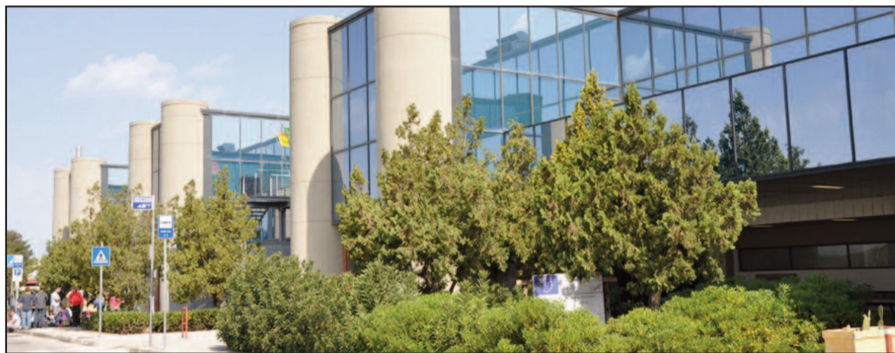
AEROPORTO DI BIRGI

Scade a metà marzo l'ultimatum relativo al pagamento delle quote del co-marketing che era stato fissato alcune settimane fa dalla Camera di Commercio di Trapani. Un appuntamento delicato per chi aspetta che si rispettino gli accordi (la Ryanair), ma anche per le amministrazioni che devono trovare all'interno dei loro magri bilanci le risorse da destinare al finanziamento delle azioni volte a potenziare i flussi turistici in entrata nel territorio trapanese. In particolare, l'attenzione di questi giorni è rivolta ai Comuni che sono chiamati a contribuire in misura maggiore al co-marketing. Proprio in questi giorni, Marsala ha regolarizzato la propria posizione: con due distinte determinazioni è stata infatti disposta la liquidazione di due tranches destinate alla Camera di Commercio di Trapani, che a sua volta le dirotterà alla società Ams - Airport Marketing Service Limited, che gestisce la comunicazione per conto di Ryanair. Si tratta di due versamenti: il primo, pari a 115.500 €, riguarda il conguaglio da corrispondere in riferimento al pe-