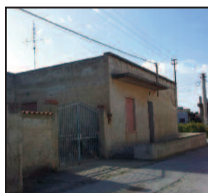
DENTRO IL CANCELLO IL POZZO IN QUESTIONE

Donna precipita in un pozzo. Salvata dopo ore