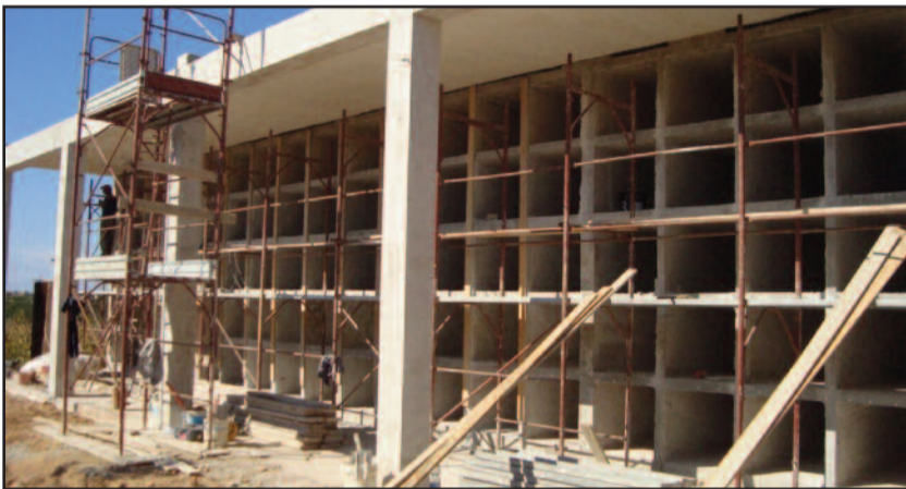
I LAVORI IN CORSO AL CIMITERO DI PETROSINO

Prosegue la riqualificazione e l'ampliamento del cimitero comunale di Petrosino. Alla vigilia della commemorazione dei defunti, sono stati ultimati i lavori dei