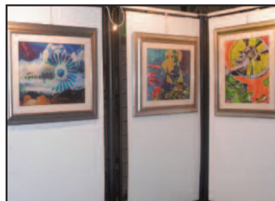
ALCUNE OPERE ESPOSTE NELLA CHIESA DI SAN PIETRO