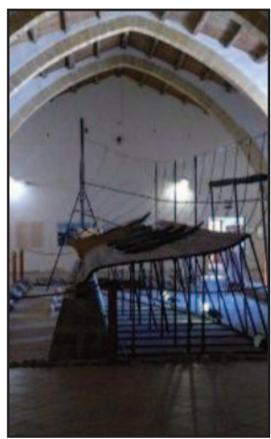
MUSEO BAGLIO ANSELMI

Nuovi orari al Museo regionale Lilibeo e nell'area archeologica in vista della stagione invernale. Domenica, festivi e lunedì il Museo apre dalle 9 alle 13.30, mentre da martedì a sabato dalle 9 alle 19. Domenica, festivi e lunedì l'Area di Capo Boeo apre dalle 9 alle 13, mentre da martedì a sabato dalle 9 alle 16.30. Il Decumano Massimo seguirà questi orari: domenica, festivi e lunedì dalle 9 alle 13.30, da martedì a sabato dalle 9 alle 13.30 e dalle 14.30 alle 16.30; La Grotta della Sibilla nella chiesa di San Giovanni al Boeo apre il lunedì dalle 9 alle 13.30. Al Museo e al Decumano bisogna munirsi di biglietto. Ogni prima domenica del mese l'ingresso in tutta l'area archeologica è gratuito.