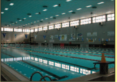
LA PISCINA COMUNALE