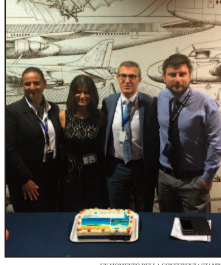
UN MOMENTO DELLA CONFERENZA STAMPA

nia, Spagna, Svezia. La compagnia ha 8 basi operative a Bucarest, Bacau, Cluj-Napoca, Costanza, Iasi, Larnaca, Liverpool e Torino. Per quanto riguarda la tratta Trapani-Torino saranno 4 i voli infrasettimanali (il martedì, sabato, giovedì e domenica) per informazioni e prenotazioni è possibile consultare direttamente il sito della compagnia (www.blueairweb.com). Bocche cucite all'Airgest sulle voci dell'attivazione di altri collegamenti per Roma e Brindisi grazie alla collaborazione con altri vettori come Aliblu Malta. "E' un lavoro complesso che richiede tempo e attenzione" è invece la risposta di Guarrera in merito alla richiesta di informazioni sull'esito del bando da 20 milioni per ripristinare le nuove tratte. [ audrey vitale ]