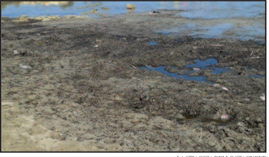
LA SPIAGGIA DELLO STAGNONE

I nostri lettori, ma anche un gruppo di turisti che frequentano la zona del litorale nord del marsalese, ci segnalano, ancora una volta, come la pulizia delle spiagge sia molto approssimativa. "Non si tratta soltanto della cosiddetta Posidonia - afferma un cittadino che ci ha contatto e che ci ha inviato alcune foto -, spesso la stessa bottiglia di plastica che abbiamo notato il giorno precedente la ritroviamo nella medesima posizione". Ci siamo informati eppure tra mille difficoltà siamo venuti a capo di una verità che già peraltro conoscevamo. Quella zona e la sua relativa pulizia è di competenza dell'ex Provincia di Trapani. I cittadini però ci chiedono di girare questa loro segnalazione anche all'Amministrazione comunale di Marsala, sul cui territorio ricade la zona di Punta Palermo, nei pressi di Villa Genna.