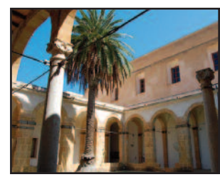
IL CONVENTO DEL CARMINE

La Direzione dell'Ente Mostra di Pittura comunica giornate e orari di ingresso alla Pinacoteca comunale per il corrente mese di ottobre. Nel Convento del Carmine, l'accesso del pubblico è possibile da martedì a domenica dalle ore 10 alle 13 e dalle 18 alle 20: lunedì chiusura. In occasione della giornata nazionale FAMU-Famiglie al Museo che si terrà domenica 12 ottobre, l'ingresso sarà nella sola mattinata: dalle ore 9.30 alle ore 13.30.