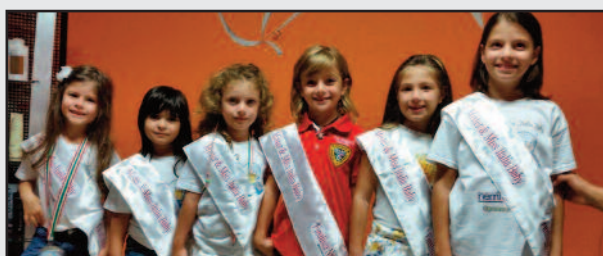
LE GIOVANISSIME PARTECIPANTI AL CONCORSO

La Villa Belvedere, in occasione della festa del nonno, ha organizzato una giornata interamente dedicata ai nonni. Con la collaborazione di volontari e di animatori, gli anziani ospiti della casa di riposo hanno trascorso una giornata all'insegna della serenità e della spensieratezza con degustazioni di piatti tipici - alla cui preparazione hanno collaborato anche loro -. La Villa Belvedere è una casa di riposo situata su un promontorio panoramico che si affaccia sul suggestivo scenario dello Stagnone e delle isole Egadi, dando la possibilità ai suoi ospiti di fare delle salubri e piacevoli passeggiate. [ ro. ma. ]