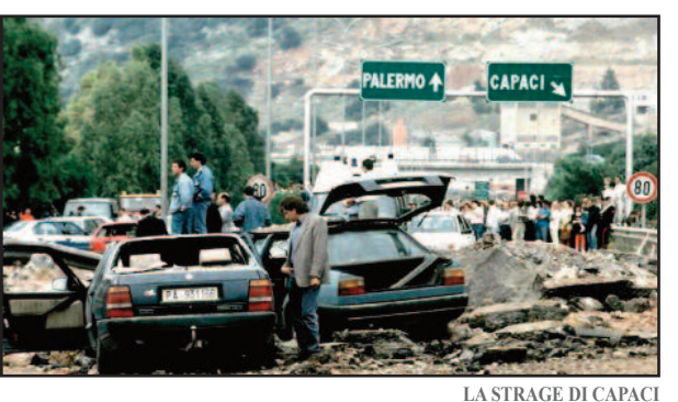
LA STRAGE DI CAPACI