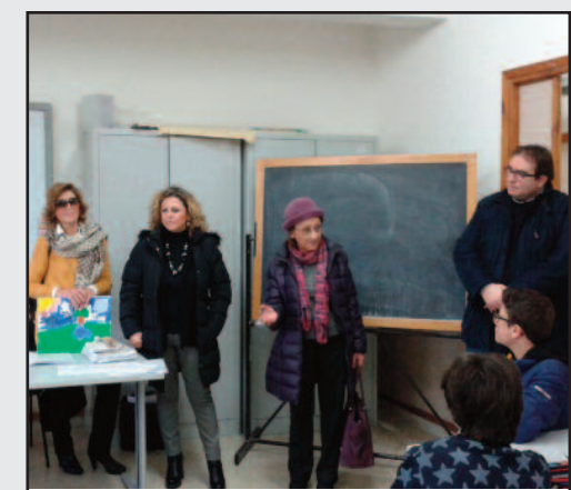
UN MOMENTO DEL LABORATORIO