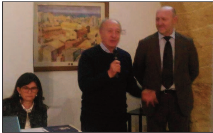
UN MOMENTO DELLA CONFERENZA

nuato Galfano -, ma da un incontro che ho avuto con il sindaco di Marsala che ha manifestato grande attenzione alle tematiche relative al Parco Archeologico, la proposta che presenteremo al competente assessorato regionale, sarà sicuramente accettata". L'impegno assunto dal comune è stato illustrato direttamente dal sindaco che si è reso disponibile a provvedere alla pulizia e alla manutenzione ordinaria del parco. Durante la conferenza Biondo ha dato l'informazione che riguarda il Museo degli Arazzi che sarà trasferito presso la chiesa dell'ex "Collegio" e per il quale sono stati stanziati 3 milioni di euro, il cui bando è in attesa di pubblicazione. [ g. d. b. ]