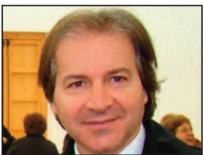
GIOVANNI LO SCIUTO

Giovanni Lo Sciuto, medico castelvetranese deputato regionale uscente è candidato ad un seggio all'Ars nella lista di Forza Italia. Onorevole, perché ha deciso di ritentare la scalata a Palazzo dei Normanni? "Per continuare il lavoro svolto in questi anni impegnandomi per le questioni che riguardano il nostro territorio. Le iniziative che ho intrapreso in tema di beni culturali devono essere seguite nell'iter di applicazione. Poi la Formazione che mi ha visto in prima linea per cercare di risolvere il problema. E infine la rete ospedaliera e la sua riforma". A proposito di rete ospedaliera e di interventi nel settore della sanità, lei di professione fa il medico, che idea si è fatta dell'attività del governo Crocetta in questa direzione? "La riforma messa in atto non è tutta da cancellare. E' sospetto l'attivismo degli ultimi mesi anche in tema di occupazione