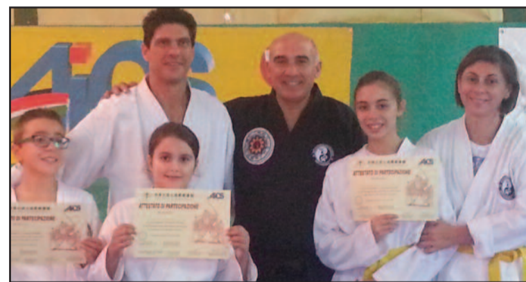
I PARTECIPANTI ALLO STAGIO