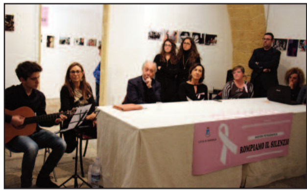
UN MOMENTO DELL'INIZIATIVA

Con l'inaugurazione della mostra fotografica legata al Concorso "Rompiamo il Silenzio", l'Amministrazione comunale di Marsala ha voluto celebrare la "Giornata internazionale per l'eliminazione della violenza contro le donne". Una partecipazione numerosissima e sentita, quella di ieri al Convento del Carmine, dove gli studenti con le loro performance hanno creato un'intensa atmosfera e vibrante attenzione. "Encomiabile l'impegno di tutti gli Istituti superiori, con dirigenti, docenti, collaboratori e alunni che hanno mostrato grande sensibilità - sottolinea Anna Maria Angileri -. Ritengo che ogni strada vada percorsa per difendere la dignità delle donne e, per questo, contiamo anche su una rinnovata coscienza dei giovani". Presenti molti componenti della Commissione Pari Opportunità, tra le quali le consigliere comunali, nonché il sindaco Alberto Di Girolamo e il deputato regionale Antonella Milazzo che hanno portato i saluti istituzionali, l'evento ha