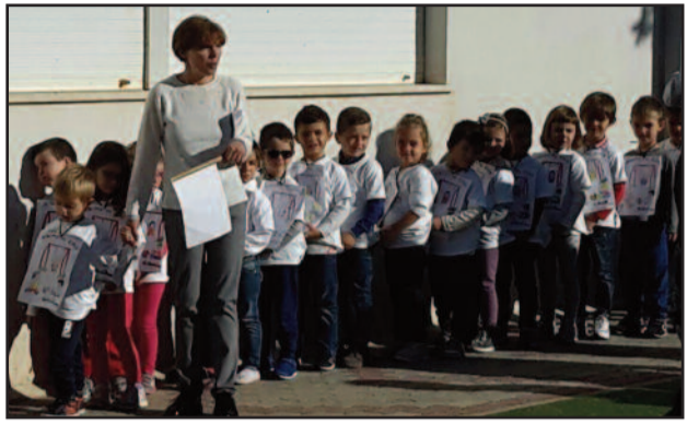
UN MOMENTO DELL'INIZIATIVA

Due plessi del 2° Circolo didattico "Giuseppe Verdi" hanno celebrato la Giornata Onu per i Diritti dell'Infanzia. Gli alunni sono stati impegnati in la-