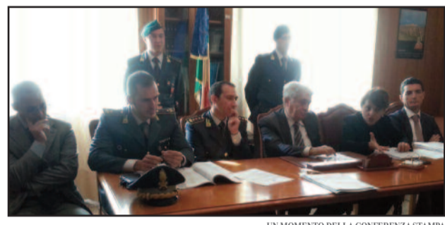
UN MOMENTO DELLA CONFERENZA STAMPA