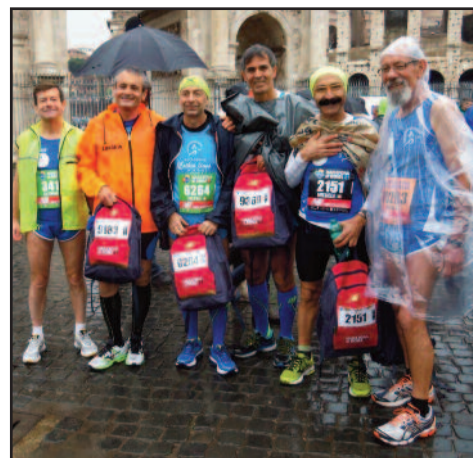
GLI ATLETI ALLA MARATONA DI ROMA