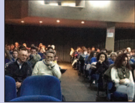
zione "Ragazzi x Ragazzi", anche questa rivolta principalmente agli studenti, con due spettacoli nella stessa mattinata.