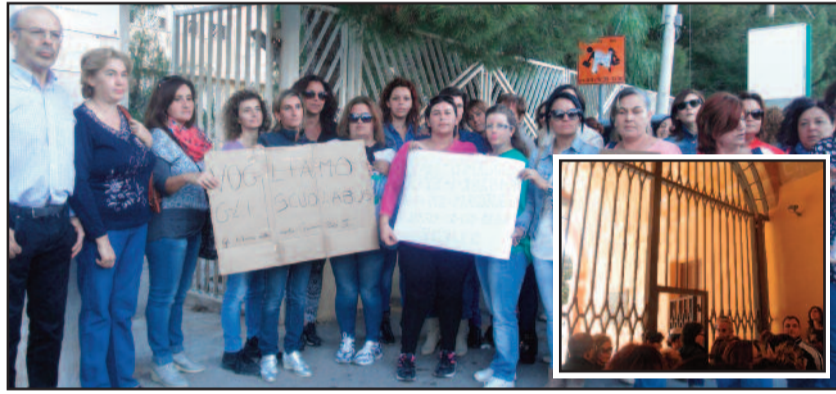
LE PROTESTE DELLE FAMIGLIE DAVANTI LE SCUOLE E AL COMUNE