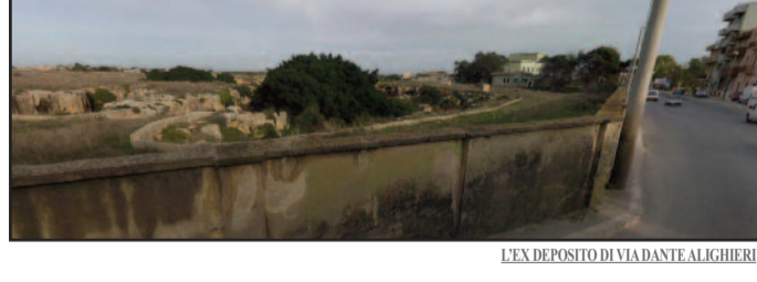
L'EX DEPOSITO DI VIA DANTE ALIGHIERI