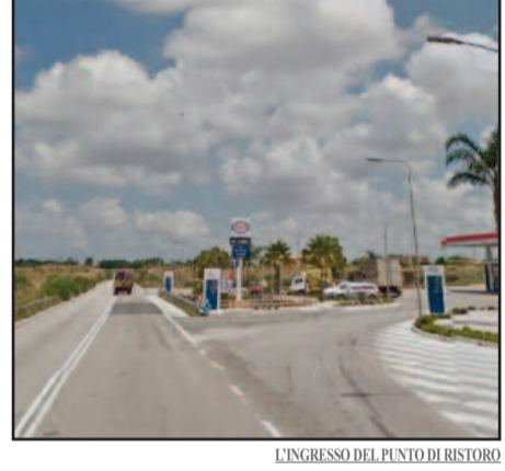
L'INGRESSO DEL PUNTO DI RISTORO