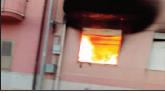
L'ABITAZIONE DEL PENSIONATO

È stato con ogni probabilità un corto circuito a determinare l'incendio divampato ieri mattina a Petrosino. L'episodio si è verificato in via Pio La Torre, all'interno di un'abitazione di proprietà di un pensionato che però non abita più lì. Il rogo è partito dalla camera da letto, ma il fumo ha raggiunto in tempi brevi tutta la casa. Avvertiti dalla segnalazione dei vicini, i Vigili del Fuoco si sono recati sul posto con due squadre che hanno domato le fiamme e riportato la situazione alla normalità.