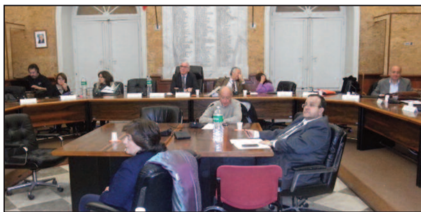
UN MOMENTO DEL CONSIGLIO COMUNALE