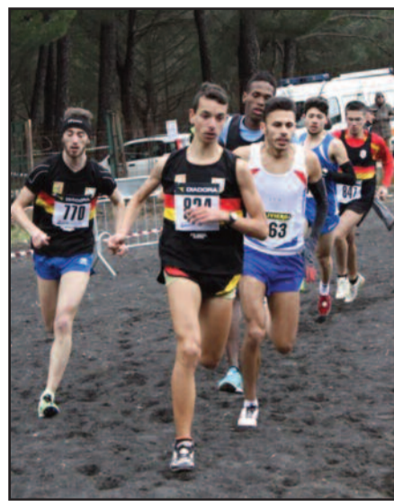
UN MOMENTO DELLA CORSA

Alla "Festa del Cross" di Gubbio sono iscritti ben 2031 atleti (1196 uomini e 835 donne) in rappresentanza di 286 società provenienti da tutta Italia. Saranno assegnati complessivamente 23 titoli italiani: 8 individuali nelle diverse categorie (assoluti, promesse, juniores, allievi) e altrettanti di club oltre alle competizioni dedicate ai portacolori delle 21 rappresentative regionali cadetti. Domenica, invece, con diretta su Rai Sport 1 dalle ore 12.45 alle 14.50 e in streaming, dalle 10 in poi, sul sito Fidal, le otto gare che, dai cadetti agli assoluti, assegneranno i titoli di campione italiano.