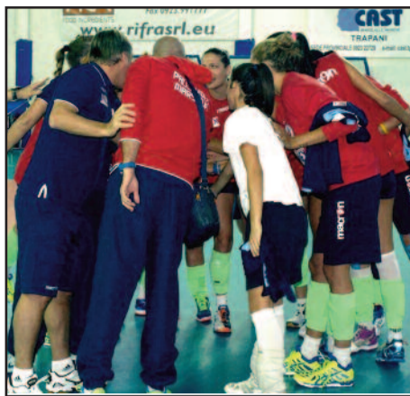
L'INIZIO DEL MATCH