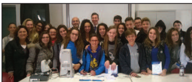
GLI STUDENTI CHE HANNO PARTECIPATO AL PROGETTO