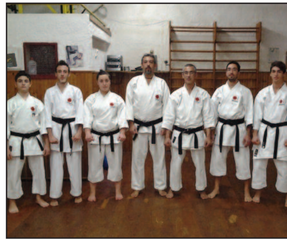
ALCUNI KARATEKI DELLA SHOTOKAN MARSALA