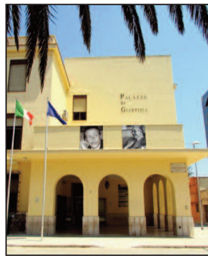
TRIBUNALE DI MARSALA