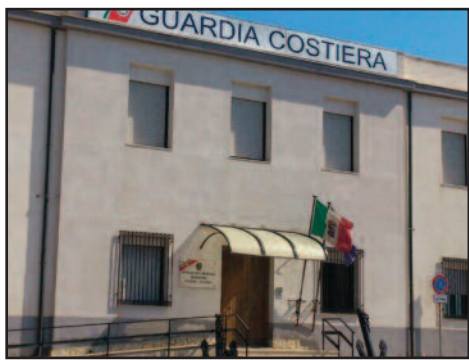
LE SEDE DELLA CAPITANERIA DI PORTO