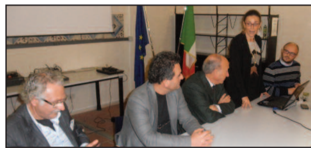
UN MOMENTO DELLA PRESENTAZIONE DEL PROGETTO