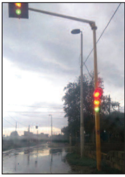
IL SEMAFORO DI VENTRISCHI IN TILT