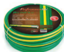
FEGTUBSM1525 Tubo per irrigazione 5 strati antitorzione Diam. 5/8" - 25 MT