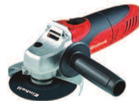
FEGTCAG125 Smerigliatrice Angolare 850W - EINHELL