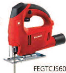
FEGTCJS60 Seghetto alternativo 410W - EINHELL