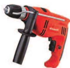
FEGTCID710E Trapano a Percussione 710W - EINHELL

I PREZZI SONO RISERVATI AI POSSESSORI DI BT CARD RICHIEDILA, È GRATIS!