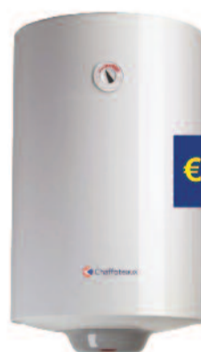
ICXEE250 Scaldacqua Elettrico 50/80 Lt. 2 anni CHAFFOTEAUX