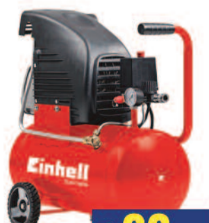
TCAC190/24 Compressore ad olio 24 Lt. - EINHELL