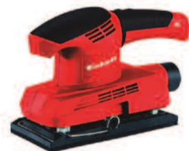
FEGTHOS1520 Levigatrice Orbitale 150W - EINHELL