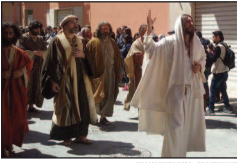
UN MOMENTO DELLA PROCESSIONE

La Processione del Giovedì Santo è la Rappresentazione della Passione di Cristo che come da tradizione si svolge nelle strade del centro storico di Marsala nella Settimana della Santa Pasqua. Quest'anno processione più lunga, lenta, ma godibile. Partita dalla Chiesa Sant'Anna ha raggiunto corso Gramsci, ha poi proceduto per Porticella salendo per corso Gramsci; poi Porta Mazara, via Mazzini e pieno centro storico. Un itinerario molto diverso dai precedenti: una volta la recita si svolgeva in Piazza Castello, dove c'è l'ex carcere che però oggi serve come parcheggio per i residenti. Unica nota, una cavalla un pò imbizzarrita che all'uscita dalla Chiesa ha generato un pò di panico tra gli "spettatori". Tutto si è comunque svolto in tranquillità, va ricordato infatti che lo scorso anno un acquazzone ha fatto rientrare subito i recitanti; l'anno prima ancora ha fatto scalpore la "cacciata" del gruppo di Gesù con gli Apostoli: questi hanno recitato la preghiera del Padre Nostro nonostante non fosse più prevista.