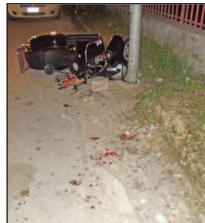
IL LUOGO DELL'INCIDENTE

grave trauma cranico. Per lui è stato disposto l'immediato trasferimento all'ospedale Civico di Palermo, dove è stato ricoverato in prognosi riservata, ma purtroppo, ieri si è spento. La Procura, dal momento dell'incidente coordina le indagini per chiarirne le responsabilità. [ c. p. ]