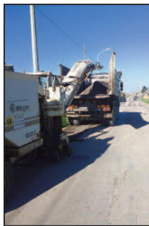
LAVORI IN CORSO DI VIA DEI PLATANI