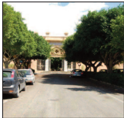
L'INGRESSO DEL CIMITERO DI MARSALA

È consentito ai genitori di età superiore a 65 anni traslare la salma del proprio figlio - già tumulato in un loculo cimiteriale di quarta/quinta fila - in un posto di