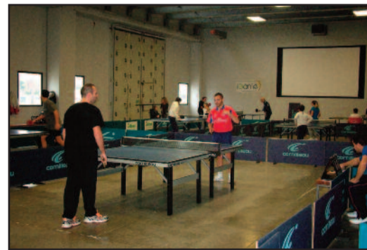
UN MOMENTO DEI CAMPIONATI