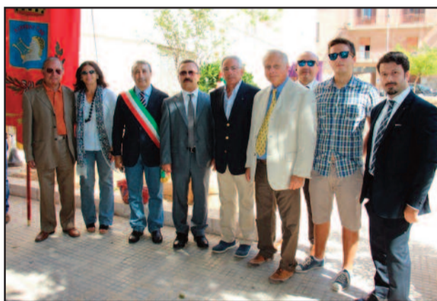
UN MOMENTO DELLA MANIFESTAZIONE