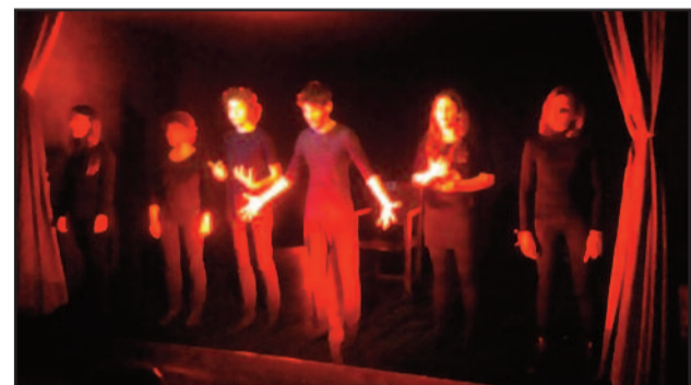
ATTORI IN AZIONE NELLA SCORSA STAGIONE TEATRALE