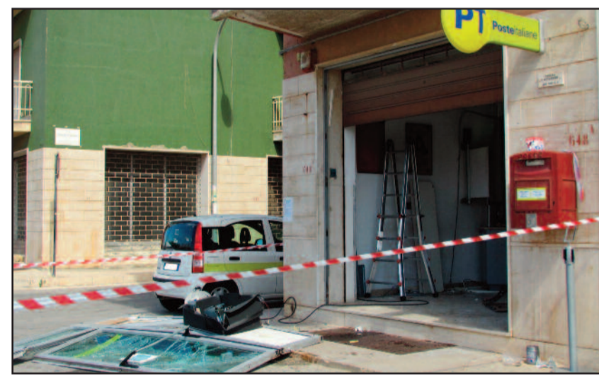
L'UFFICIO POSTALE DI STRASATTI

È accaduto nella notte, forse alle prime luci del mattino, sulla via Nazionale, in contrada Strasatti. Dei malviventi, forse in due, prima si sono procurati un camion con una gru e poi si sono diretti verso la posta di Strasatti. Qui è difficile operare indisturbati. La via è sempre transitata, anche di notte e lo è soprattutto in questo periodo in cui, essendo iniziata la vendemmia, in molti escono di casa prima dell'alba. I malviventi hanno letteralmente buttato giù la porta e staccato dall'edificio la cassetta del bancomat. Poi tutto è stato trascinato lungo la via, mentre il vetro e i congegni elettronici si spaccavano. Eppure pare che nessuno si sia accorto di nulla. Per avviare le indagini sono intervenuti sul posto i carabinieri del NORM e quelli della stazione di Petrosino. Verifiche sono state effettuate anche dai militari della sezione scientifica che stanno controllando ogni segno lasciato sul posto. I pezzi del postamat sono stati raccolti lungo la via per almeno venti metri. Anche il camion usato per stac-