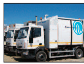
I FURGONI DI AIMERI AMBIENTE