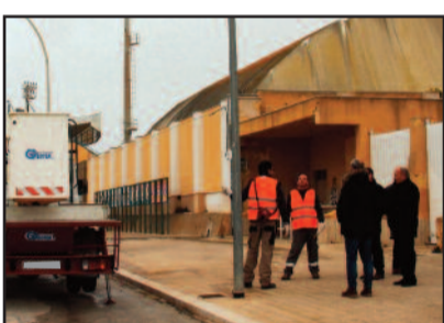
ZONA STADIO - IL SOPRALLUOGO DEL SINDACO E DELL'ASSESSORE

ministrazione conta di intervenire su tutto il territorio del comune ponendo fine agli inconvenienti che la mancata illuminazione pubblica arreca alla collettività". La nostra testata ha dato ospitalità, nei mesi scorsi, quasi quotidiana alle segnalazioni che ci sono giunte dai cittadini. L'elenco è lunghissimo e si può certamente affermare che sono poche le strade e pochissime le contrade che presentano una illuminazione adeguata. Non sappiamo se questo primo step potrà raggiungere tutto il territorio. In tempi invece più lunghi c'è da ricordare il finanziamento dei fondi denominati "Jessica" che dovrebbe consentire di sostituire tutte le lampade pubbliche con altrettante di nuova generazione e a basso consumo. Per quanto riguarda la manutenzione della rete di pubblica illuminazione in corso, l'aggiudicazione alla ditta Geotex di Agrigento è avvenuta sulla base di circa 130 mila euro. Alla gara hanno partecipato un lotto di oltre 40 ditte. [ g. d. b ]