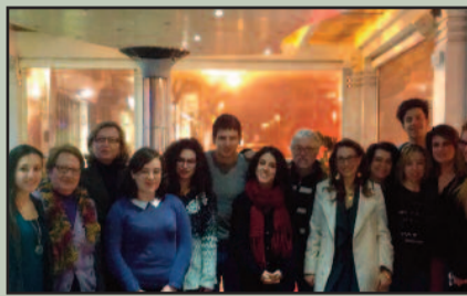
UN GRUPPO DEL PASCASINO CON GLI STUDENTI STRANIERI