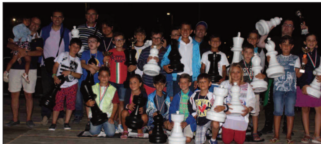
FOTO DI GRUPPO - UN MOMENTO DELL'INIZIATIVA