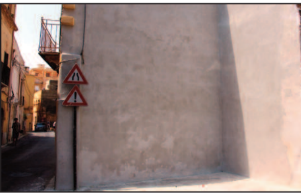
LA PARETE DOVE VERRÀ REALIZZATO IL MURALE