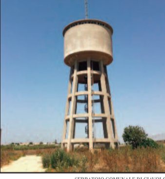
SERRATOIO COMUNALE DI CIAVOLO

Ieri abbiamo parlato di acqua con riferimento all'allarme siccità che toglie (giustamente) il sonno ai viticoltori del territorio. Tuttavia i problemi idrici che sta vivendo Marsala sono molto più radicati e coinvolgono utenze diverse. Nelle ultime ore l'ennesima rottura della condotta idrica (stavolta in via Tunisi) ha creato gravi disagi ai residenti del centro storico e delle aree limitrofe, con inevitabili ricadute anche sulle attività commerciali, i bar, i ristoranti e le strutture turistiche, che lamentano anche una certa difficoltà a mettersi in contatto con i recapiti comunali (l'ufficio stampa ieri ha comunque invitato a contattare il centralino della Polizia Municipale: 0923723303 - 0923993100 - 0923993135). A fronte di un'emergenza che riguarda il centro e le aree limitrofe, c'è però un disagio ormai cronico che stanno vivendo quotidianamente i cittadini del versante nord della città, da oltre un mese senz'acqua. [...]