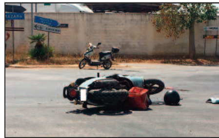
IL LUOGO DELL'INCIDENTE

tuato i rilievi del caso, intervenendo anche per regolare il traffico veicolare in un incrocio considerato particolarmente critico. Per rimettere in sicurezza la carreggiata e ripristinare la praticabilità della carreggiata sono invece intervenuti gli addetti della ditta Ecolisia.