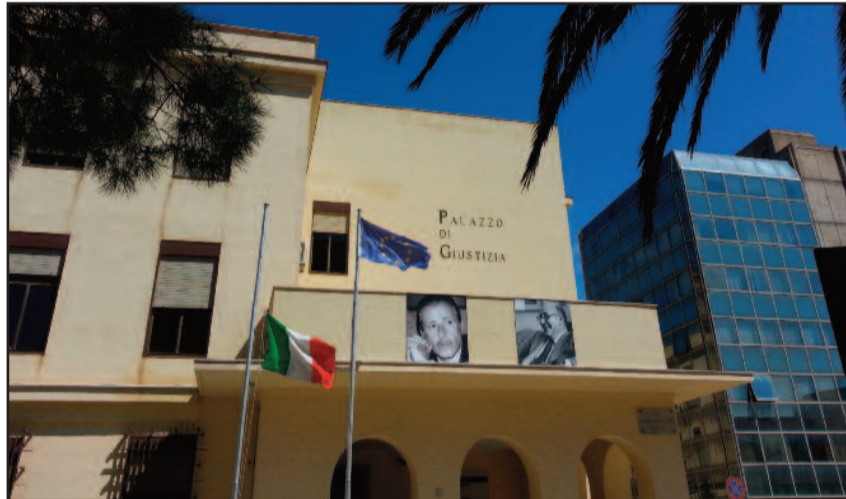
TRIBUNALE DI MARSALA