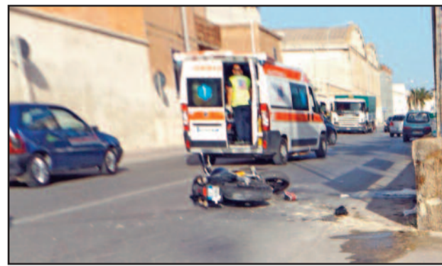
IL LUOGO DELL'INCIDENTE SUL LUNGOMARE MEDITERRANEO