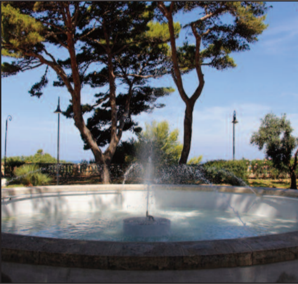
LA FONTANA DEL BASTIONE SAN FRANCESCO

Dopo decenni di inattività, è stata rimessa in funzione la fontana nella parte alta di Villa Cavallotti. E' quella collocata su, sul bastione San Francesco che si erge tra viale Isonzo e via Colocasio. La fontana necessitava di sostituzioni di parti dell'impianto idrico, la sistemazione di quello elettrico, nonché rifacimenti alle pareti di contenimento dell'acqua. Questa, ora, fuoriesce da quattro zampilli laterali e da uno centrale.