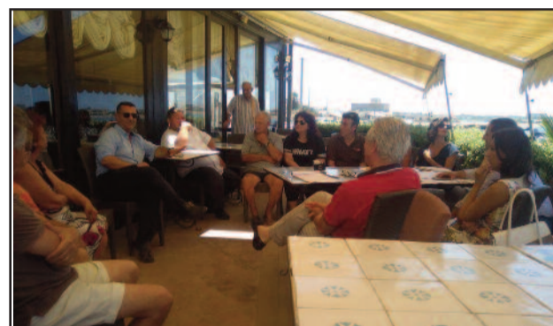
UN MOMENTO DELL'INCONTRO

sibile sede del "Museo della civiltà contadina" con annesso uno spazio di ristoro. In secondo luogo è stato illustrata l'acquisizione e il restauro della "famosa" torre di Sibiliana, che dà il nome all'intera zona. Dopo l'esproprio e il successivo intervento di restauro diventerà sede del "Distretto Culturale Evolutivo Art'Oasis". L'intervento prevede un investimento di circa 2 milioni di euro. Somma che dovrebbe essere messa a disposizione da un finanziamento statale che è stato richiesto la cui risposta è attesa a giorni. Il sindaco ha illustrato anche un intervento che dovrebbe avere una veloce attuazione. Tramite un investimento totale di circa 400 mila euro, che comprende la riattivazione delle linee non funzionanti, la revisione e l'ammmodernamento dei quadri elettrici, il ripristino dei pali