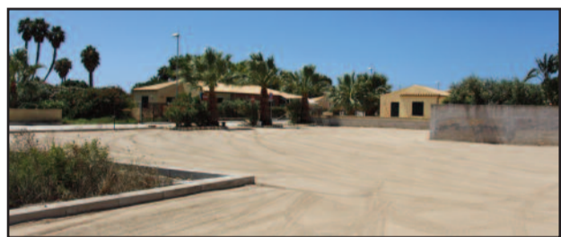
IL PARCHEGGIO DEL SIGNORINO

l'aver unificato la tariffa, consentirà a quanti hanno sottoscritto l'abbonamento per la sosta sulle strisce blu (35 euro mensili) di potere parcheggiare anche nell'area comunale del "Lido Signorino". Qui, la sosta a pagamento resterà operativa fino al prossimo 18 settembre. È la Polizia Municipale che coordina la predisposizione della relativa segnaletica e dei controlli. Inoltre è migliorata la fruibilità dei parcheggi comunali di contrada Berbaro, ripuliti da sterpaglie e rifiuti. "È stata rasa l'erba infestante e applicato un telo di plastica