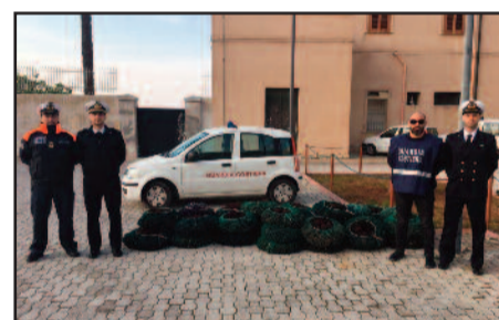
LA GUARDIA COSTIERA CON I RICCI SEQUESTRATI

territorio. I ricci di mare erano stati presumibilmente raccolti nelle acque antistanti le isole Egadi. Sul posto è intervenuta anche una pattuglia dei Carabinieri della Stazione di San Filippo. I ricci, ancora vivi, sono stati rigettati in mare con l'ausilio di un'unità navale della Guardia Costiera e "restituiti" al loro habitat naturale. Il blitz ha portato all'elevazione di verbali per un ammontare complessivo di 8mila euro di sanzioni amministrative