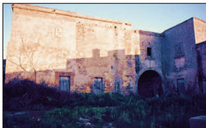
L'INTERNO DEL BAGLIO PERINO

presenta un disegno unitario: il nucleo originario del complesso è una torre, ancor oggi visibile nel corpo centrale dell'edificio, attorno alla quale si sono aggregati in epoca successiva alcuni magazzini, che insieme hanno chiuso uno spazio centrale di forma rettangolare di notevoli dimensioni. Le vicende costruttive confermano quanto detto all'inizio: la torre intorno a cui si sviluppa la struttura è legata all'economia pastorale, dominante in quell'area, quando gran parte delle terre circostanti erano ancora pascoli comuni. La privatizzazione delle terre comunali, attraverso l'enfiteusi, fa sviluppare prima la cerealicoltura e in un secondo momento la viticoltura. A queste mutate esigenze viene adattata nel tempo la struttura preesistente con la costruzione dei magazzini e delle abitazioni che chiudono e definiscono il perimetro del baglio, dandogli la forma che ha ancora oggi. Baglio Perino ha un portale d'ingresso con arco a sesto ribassato, che immette in un androne con volta a botte. La residenza principale, costruita a sud, ad angolo sull'ingresso, da una parte prospetta sulla corte interna, dall'altra si affaccia all'esterno