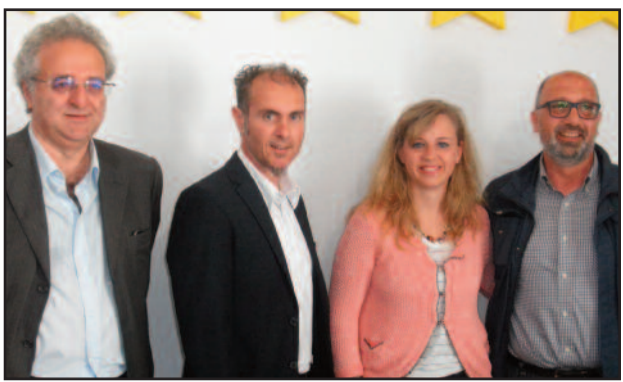
VINCI, SANTANGELO, PALMERI E RODRIGUEZ

Presentata ieri mattina la prima applicazione su piattaforma pubblica per la segnalazione dei problemi o dei disservizi del territorio. Alla conferenza stampa che si è tenuta nella sede del M5S di Marsala, erano presenti il consigliere comunale Aldo Rodriguez, il senatore Vincenzo Santangelo e la parlamentare regionale Valentina Palmeri. Il progetto è stato curato da alcuni attivisti del meet up lilybetano ed è stata illustrata dal tecnico informatico Antonino Chirco. "L'applicazione, che è totalmente gratuita, si può scaricare dall'app store di Google e si trova per il momento su piattaforma Android - ha detto l'attivista pentastellato - I cittadini, una volta scaricata l'app, si troveranno una sorta di elenco di tematiche per la segnalazione, ad esempio, rifiuti, illuminazione pubblica, buche nelle strade, abusivismo edilizio o inquinamento ambientale e una volta scelto il tema possono scattare la foto e pubblicarla". "Un Comune che riceve le segnalazioni dei cittadini è un comune fortunato, - ha detto il senatore Santangelo -. E' una possibilità per l'amministrazione di questa città, ma anche per le altre, perché quest'app ci è stata richiesta da alti meet up locali. La proporrò immediatamente alla candidata alla carica di sindaco del comune di Roma, Virginia Raggi". Il Consigliere comunale pentastellato, Aldo Rodriguez si è detto amareggiato dell'assenza del sindaco e delle giunta e di suoi colleghi Consiglieri che