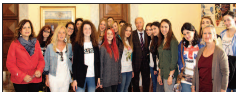
GLI STUDENTI DEI LICEI DI MARSALA ED ASSISI