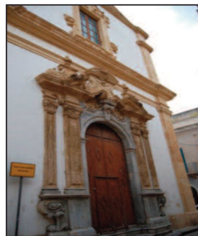
CHIESA SAN GIUSEPPE