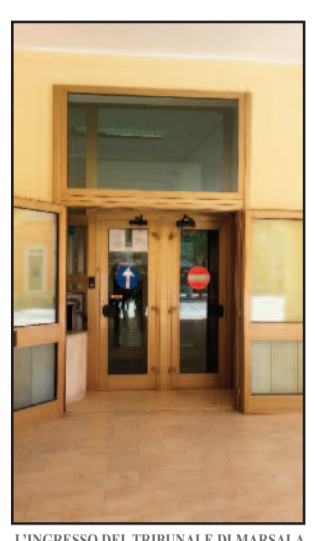
L'INGRESSO DEL TRIBUNALE DI MARSALA