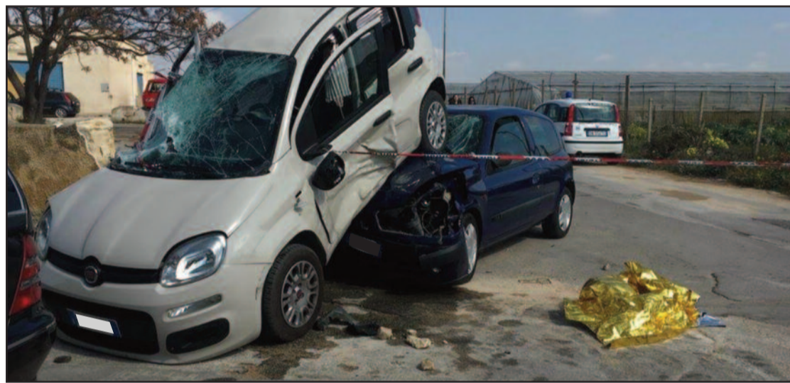
IL LUOGO DELL'INCIDENTE