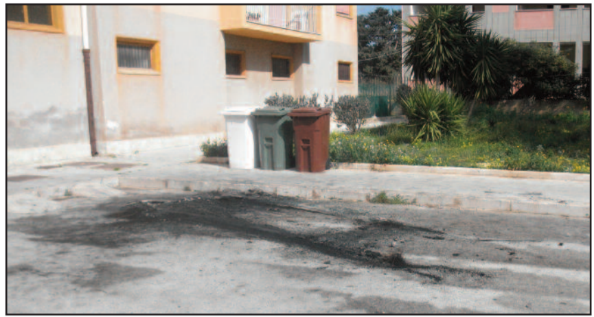
IL LUOGO DELL'INCENDIO

Va a fuoco una vettura di grossa cilindrata. E' accaduto nella notte tra giovedì e venerdì nel popoloso quartiere di viale Regione Siciliana, meglio noto ai marsalesi come quello di "via Istria". La macchina di grossa cilindrata, verso le 2 della notte per cause ancora da accertare, ha preso fuoco. Sul posto sono giunti i Vigili del fuoco del distaccamento di corso Calatafimi, che hanno provveduto a domare le fiamme. Non si conoscono i motivi che hanno generato l'incendio. Nella zona non sono nuovi episodi dolosi, ma anche un corto circuito nel vano motore non è da escludere. Nella tarda mattinata la carcassa della vettura è stata rimossa.