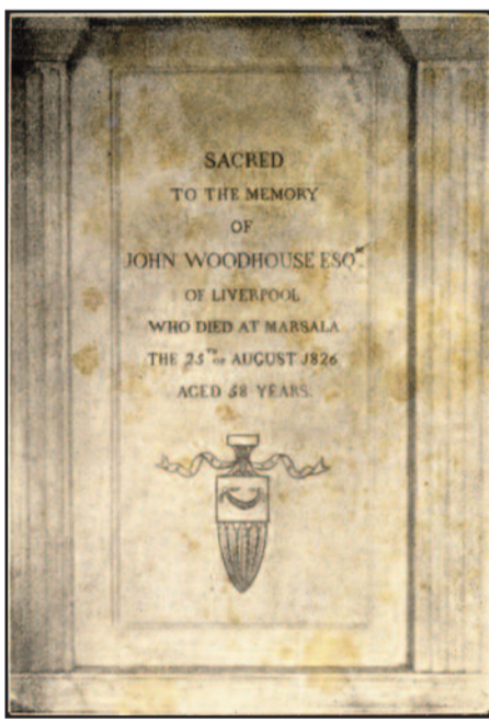
LA LAPIDE DEL MAUSOLEO DI JOHN WOODHOUSE CON LA DATA DI MORTE ERRATA