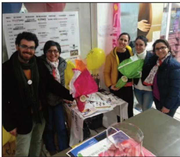
I VOLONTARI AIL