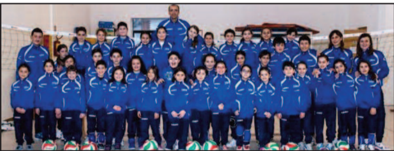
LA POLISPORTIVA OLIMPIAKOS MARSALA

Volge al termine anche il campionato di Promozione. La formazione della Borgata, ancora in corsa per la Coppa Italia, lo scorso weekend, in occasione della penultima giornata del torneo, è stata sconfitta in quel di Castelvetrano da una Folgore, ormai matematicamente ai play off, che ha fatto una sorta di prove generali per tentare la scalata all'"Eccellenza". Dopo le festività pasquali, i lilybetani chiuderanno la stagione tra le mura amiche ospitando, invece, il Raffadali, formazione questa già promossa nel massimo campionato regionale.