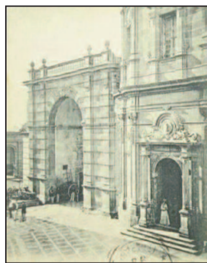
LA CHIESA DELL'ADDOLORATA