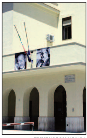
TRIBUNALE DI MARSALA