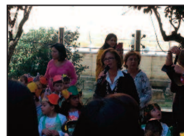
UN MOMENTO DELL'INIZIATIVA