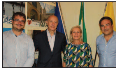
GLI ARCHEOLOGI SPAGNOLI INSIEME AL SINDACO E ALL'ASSESSORE